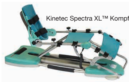
Kinetec Spectra XL™ Komfort Auflagen